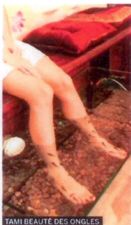
TAMI BEAUTÉ DES ONGLES

➤ 60, AV. DULUTH E. | 514 842-8588 MANUCURES: DE 6 $ À 15 $; PÉDICURES: DE 12 $ À 35 $. POISSONS EN SUS (20 $ LES 15 MINUTES, 35 $ LES 30 MINUTES)