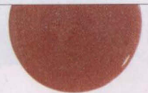
DS Classic d'OPI