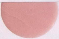
Bubble Bath d'OPI

TESTÉ PAR CANDICE, COORDONNATRICE DE LA RÉDACTION