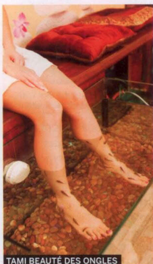
TAMI BEAUTÉ DES ONGLES

➤ 60, AV. DULUTH E. | 514 842-8588 MANUCURES: DE 6 $ À 15 $; PÉDICURES: DE 12 $ À 35 $, POISSONS EN SUS (20 $ LES 15 MINUTES, 35 $ LES 30 MINUTES)