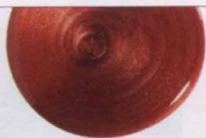
Brisbane Bronze d'OPI